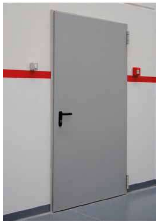
Puerta cortafuegos reversible