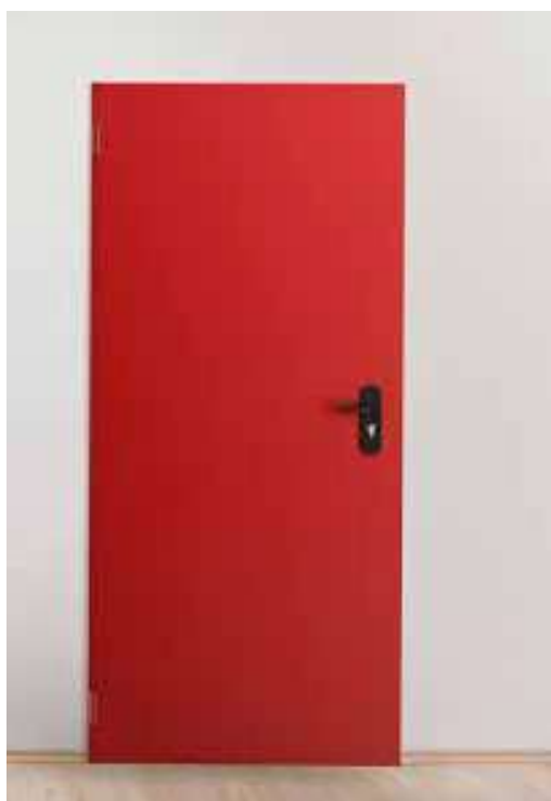
Puerta multiuso reversible